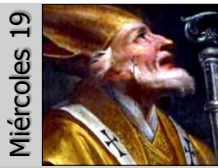
Miércoles 19 Mansueto de Milán (S. VII)