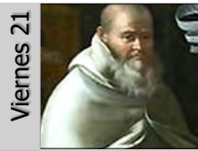
Viernes 21 Pedro Damiani (S. XI)