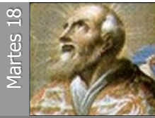
Martes 18 Eladio de Toledo (S. VII)