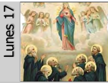
Lunes 17 Fundadores de los Servitas (S. XIV)