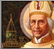
Ruperto (S. VIII)