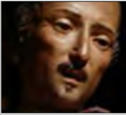
José Oriol (S. XVIII)