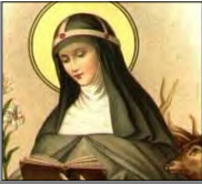
Catalina de Suecia (S. XIV)