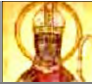
Pedro de Sebaste (S. IV)