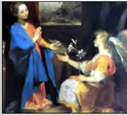
Anunciación del Ángel a la Virgen