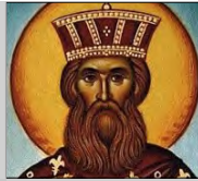
Gontrán (S. VI)