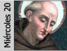
Bernardino (S. XV)