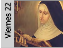
Rita de Casia (S. XV)