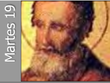
Celestino V (S. XIII)