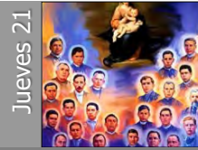
Mártires mexicanos (S. XX)